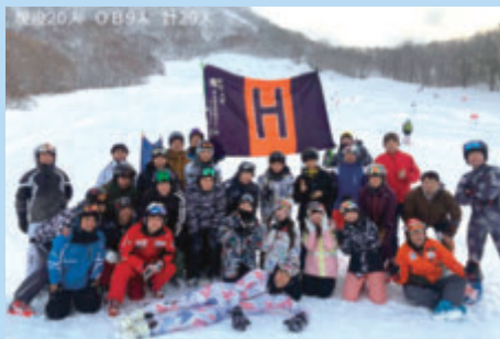
OB対抗戦 2020 in木島平 2020.2.8

こんな時期だからこそOB会名簿の再整備をハガキやメール等で実施しました。(突然、ハガキやメールが送られてきたので、OBの中には『フィッシング詐欺』と勘違いした人もいたことでしょうか!?)