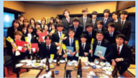
コロナ以前のコンパでの笑顔