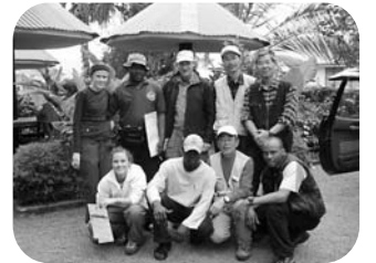
ホテルで全員で記念撮影

7月10日：ホロンボハット～マランゲート～モシ 下山は登りの半分の時間です。マランゲートで登山者カードに記入し、ウフルピークの登頂証明書を交付してもらいます。ホテルで1週間ぶりのシャワー、食堂で銘柄『Kimanjaro』ビールで乾杯。疲労困憊で食が進みません。