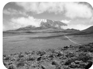
砂漠地帯(正面、キリマンジャロ)

7月8日：ホロンボハット～キボハット いよいよ4000M地帯を行きます。未知の高さです。不安が一杯。いよいよ砂漠地帯。キリマンジャロの全体像がはっきり目の前にあらわれます。途中、高山病でしょう、救助用の1輪車に乗せられ下山していく登山者が行く。なにか不安感が…夕方、キボハット到着(標高4703M)明日の登頂のブリーフィング、出発は23:30。寒いから衣服の上下とも4枚は必要、ヘッドランプ・水を忘れずに、出発まで充分睡眠をとるように夕食後5時間程ウツラ・ウツラします。緊張と不安で熟睡は出来ません。