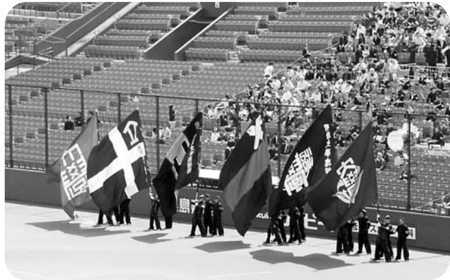
六旗会(東京六大学応援団OB・OG会)