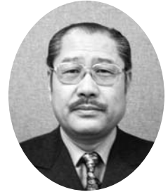
法政大学工体連OB会会長

本部の存在意義をも考えさせられる許認可制度となる様です。事実、本部にはその都度申請での補助の余地は残されていますが、このままでは組織体として活動維持が難しくなってきます。本詳細は今後に適宜触れてまいります。活動の主体は学生にありますが、結果としてOBの存在、OB会の存在が問われようとしております。